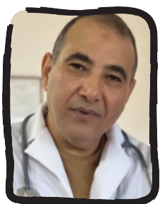
د.محي الدين الغرياني

يذكر في هذا السياق أن وزارة الصحة أطلقت في فبراير الماضي مشروع (100) يوم لإصلاح قطاع الصحة، وقد انتهت المائة يوم الاثنين (25 مايو 2026م)..